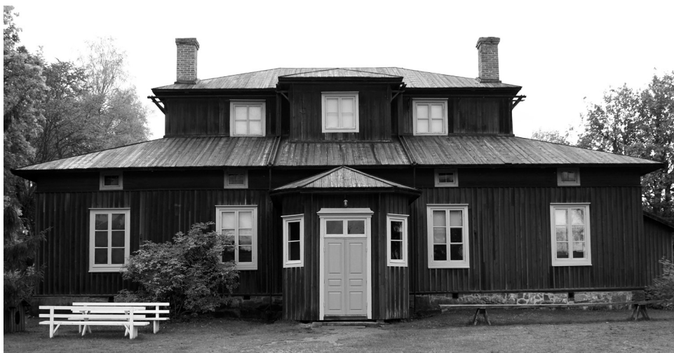
Frugård i Mäntsälä.