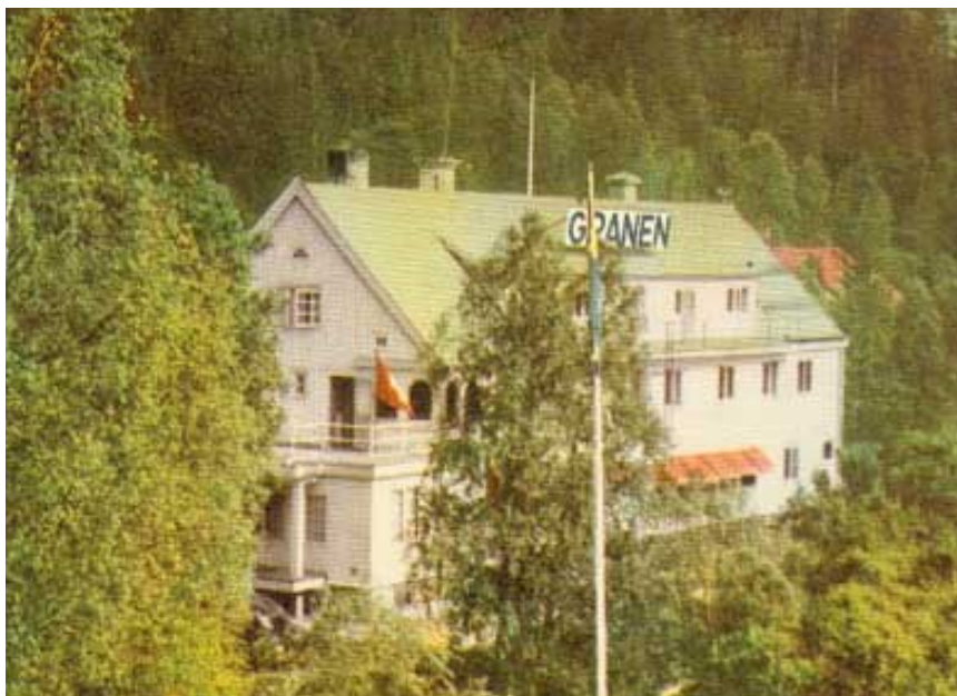
Hotell Granen, bilden är ett vykort från ca. 1950