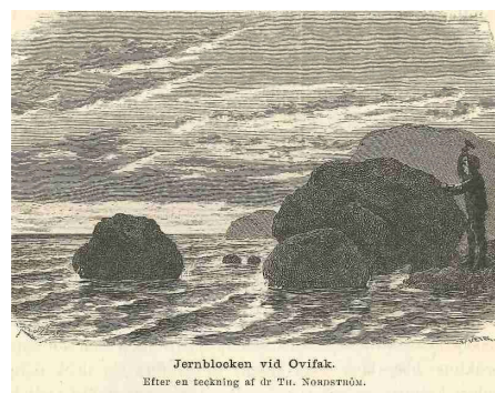
Järnblocken vid Oifak

Briggen Tre Kronor af Stockholm är en välkänd syn för många där den ligger förtöjd i sin hemmahamn på Kastellholmen eller då den seglar till olika evenemang i Östersjön. Vad inte lika många känner till är kopplingen mellan briggen Tre Kronor och släkten Nordenskiöld. Sökandet efter meteoriter var ett hett område under 1800-talet, som även engagerade A.E. Nordenskiöld. År 1870 besökte han Grönland för att utföra naturhistoriska forskningar kring inlandsisen och för att förbereda en Nordpolsexpedition. Han ville bl.a. utröna om eskimåhundar kunde användas för ett sådant uppdrag. Men med tanke på att expeditionen ägde rum kort efter det mest kända meteoritnedslaget i Sveriges historia, (Hesslemeteoriten) kan man tänka sig att även sökande efter meteoriter låg högt på agendan. Förekomster av järnhaltiga stenar på Grönland som antogs vara meteoriter, hade varit kända sedan tidigt 1800-tal. Kunskapen baserades på att eskimåer sagt att det järn de använde till sina verktyg utvunnits ur stora stenblock. Vid foten av Ovifakfjället på Diskoön fann Adolf Erik med eskimåernas hjälp till sist ett antal stenar och block med mycket hög järnhalt, de s.k. Nordenskiöldska järnmeteoriterna. Några av dessa stenblock var mycket stora och Adolf Erik kunde under sin expedition 1870 endast ta hem några få av de mindre fynden.