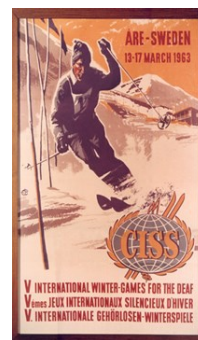
Affisch för vinterspelen