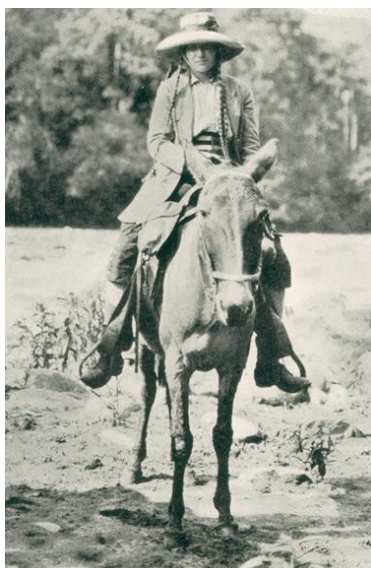
Forskningar och äventyr i Sydamerika 1913-1914.