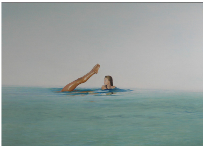
"De badande", olja på duk, 143X200 cm