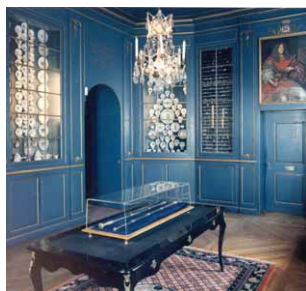
Blå hallen på Riddarhuset