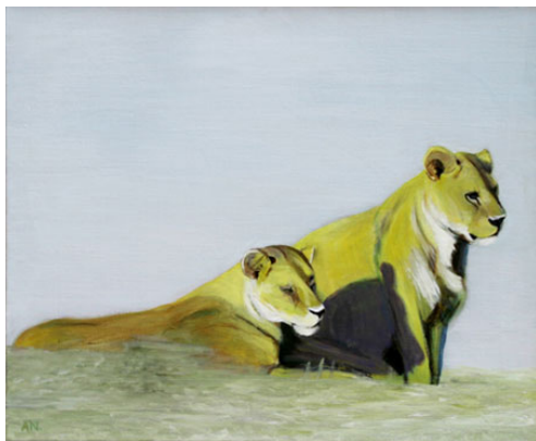
"Två lejon" Olja på pannå, 2004-2007